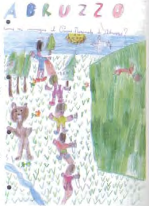
Carlotta Maquignaz classe 3 a