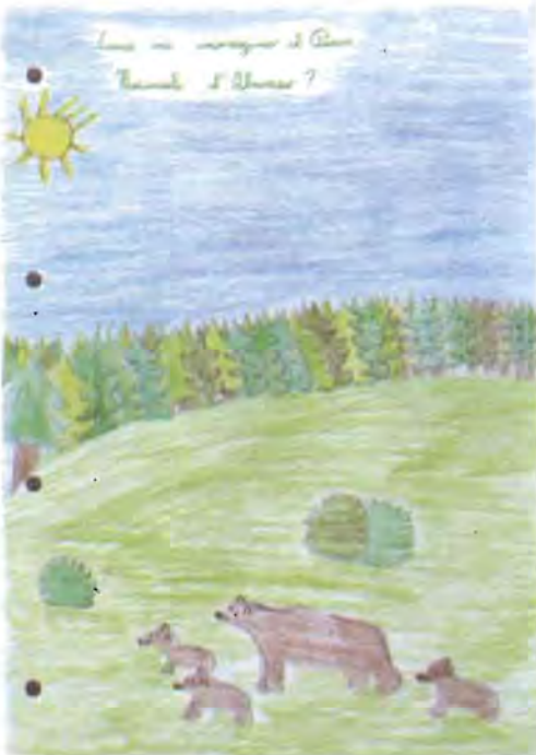
Caroline Frassy - classe 5 a