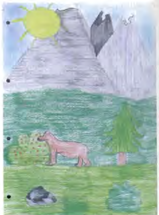
Caroline Frassy - classe 5 a

Ensuite ils ont travaillé en groupe ou individuellement pour faire des recherches sur les sujets qu'ils avaient décidé auparavant.