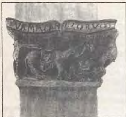
Chapiteau n.° 19

mette nel chiostro , capolavoro della scultura romanica, costruito - come si è detto - ad una data vicina al 1132. La struttura originaria, in parte alterata da alcuni rifacimenti, tra cui la costruzione delle volte tardoquattrocentesche e il rifacimento del lato orientale nel XVIII secolo, prevedeva un numero maggiore di capitelli e una diversa successione dei soggetti; l'ala orientale presumibilmente era analoga a quella occidentale nell'alternanza di colonne semplici e binate. Anche il colore nero che attualmente ricopre in modo uniforme tutti i sostegni, steso ad un'epoca imprecisata, non corrisponde all'aspetto originale del chiostro, che dobbiamo immaginare ravvivato da una raffinata policromia: bianchi i capitelli, scolpiti in marmo di Carrara, con le iscrizioni e altri particolari rialzati di rosso; grigio-verde con screziature le colonne e le imposte alla base degli archi in bardiglio di Aymavilles; nuovamente bianche le basi in marmo. Le vigorose sculture dei capitelli e la poli-