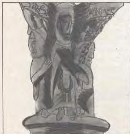
Chapiteau n. 35

Il capitello ricorda alcuni tra gli episodi salienti relativi alla sua vita: dapprima si vede il santo davanti alla sua chiesa in atto di