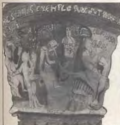
Chapiteau n° 32

benedire i poveri; quindi è rappresentato il fatto prodigioso secondo il quale, battendo con il suo bastone, Orso avrebbe fatto scaturire una sorgente d'acqua in località Busseyaz, allontanando il pericolo della siccità; segue infine la vicenda della conversione del palafreniere di Ploceano, che cercava il cavallo più bello del suo signore senza avvedersi di esservi assiso; il giovane viene in seguito preso e torturato dagli sgherri di Ploceano, al quale Orso predice la fine imminente. La profezia si avvera nell'ultima scena, che raffigura un diavolo che strangola il vescovo crudele, mentre altri demoni e corvi si avventano sul suo cadavere.