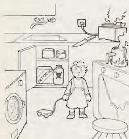
Illustration tirée de "I bambini e il rischio ambientale" La Nuova Italia Editrice

On souhaite la production de matériel didactique pour la diffusion/socialisation de l'expérience (journal de classe, vidéo, série de diapos etc.) afin de sensibiliser et/ou d'impliquer d'autres enseignants et d'autres enfants dans les activités d'Éducation à la santé.