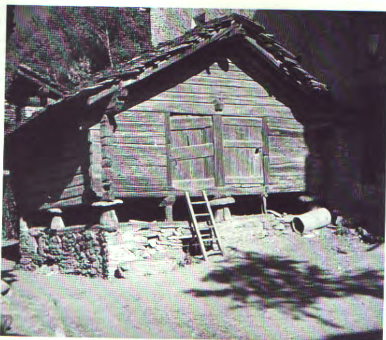
Superbe rascard (XV ème siècle) de Saint Marcel

mations s'étend sur un demi-siècle (1861-1911), marqué par une crise économique profonde (écroulement de la vieille métallurgie au charbon de bois, difficultés agricoles) et une émigration massive à l'étranger.