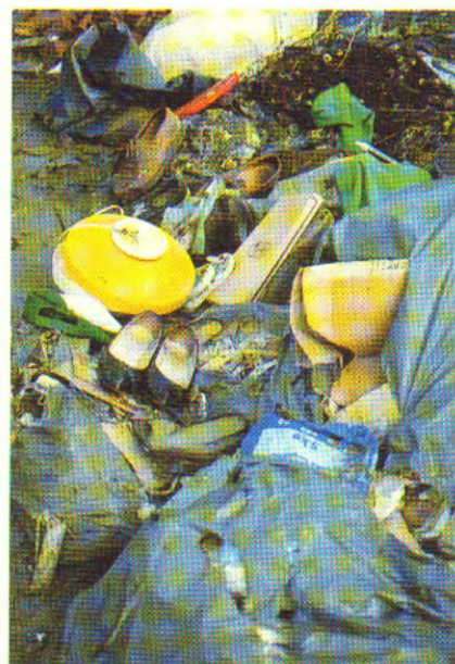
Un "bel" étalage de déchets!

● Comparer les transformations d'un même matériau par la "mise en décharge" (expérience indiquée par la fiche) et par l'incinération.