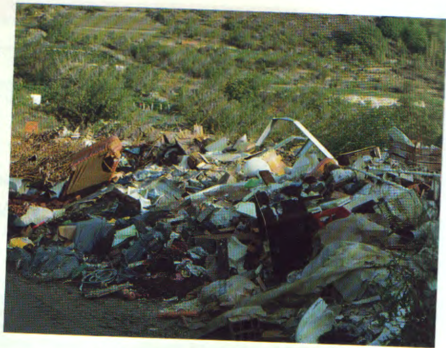
Un "bel" exemple de décharge sauvage.