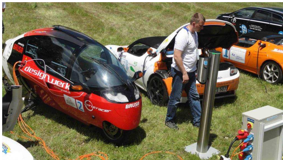
Mezzi elettrici in esposizione ad Aymavilles