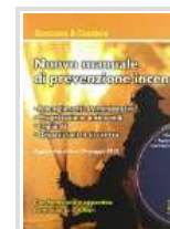
IL MANUALE DI