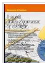
I COSTI DELLA