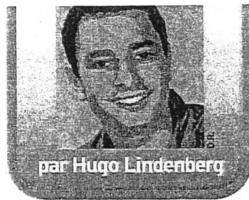
par Hugo Lindenberg