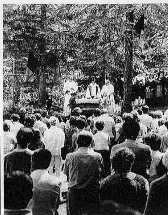
La «Rencontre» per gli emigrati valdostani è giunta alla diciottesima edizione

calendario al palatena la manifestazione dal titolo «La carica del 101». La Pro loco di Champorcher organizza per domani in località Chardoney, alle 12, un pranzo a base di polenta. A Pont-Saint-Martin prosegue oggi la festa patronale con un torneo di «calcio ballala». Alle 20,30 il concerto della banda musicale di Pont-Saint-Martin, in seguito si ballerà con l'orchestra «Harmony Show». Nei padiglioni allestiti nei giardini pubblici della Pro loco sono aperti stand enogastronomici. Domani il paese della Bassa Valle ospita invece la penultima giornata del tradizionale «Mercé del ghetto», organizzato dalla biblioteca comunale. Ci saranno bancarelle con oggetti tipici, alimenti naturali, pezzi d'antiquariato e prodotti artigianali. Due appuntamenti sportivi a Gressoney-La-Trinité. Oggi alle 11 gara di golf «Coppa Montrose ski». Domani è invece in programma la gara di mountain bike, valida come prova del campionato italiano. [r. s.]