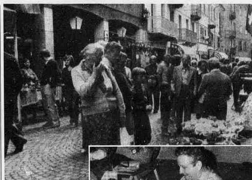
Un momento della «Foire d'été» che si tiene ogni anno in centro ad Aosta. A fianco una «veillà» la rappresentazione delle serate trascorse in passato in Valle

Vecchi mestieri, usi, costumi, artigianato, musica e poesia degli ultimi cento anni a Nus rivivono questa sera nel vecchio borgo del paese con «Lo net di tradicions», un'iniziativa curata dall'amministrazione comunale, dalla Pro loco, dalla Scuola di cultura e dai «Reuveness». Stasera a Nus ci saranno nella parte sinistra del borgo artigiani locali del legno, del ferro e lavorano i pizzaioli, i calcolai di un tempo, la produzione del pane nei vecchi forni, la scuola di scultura, la scuola di alpina, l'«etambra di dames», il macellaio, la modista, il pasticciere e il produttore di pannocciata, servita all'ingresso del paese come biglietto da visita. Nella parte a monte del paese si troveranno la scuola di scultura, lo «pillon di papà e mamma», il gerlino, il boscaiolo, il tornitore, il sabotaro, il bottaio, il fabbro, il maniscalco, il falegname, le sartie, le magliate, le danze tipiche. L'esteria con la distribuzione della «seupa freide», il caffè alla valdostana, il gioco alla morra, la «seupetta» (frittelle), la battitura del gra-