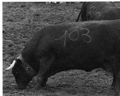
"Soulida" de Lucien Cuc d'Aymavilles.

Dans l'après-midi du 4 août à Vertosan s'est déroulée la dixième élimination du 45 ème Concours régional des Batailles de Reines. Au total six bovins ont été en finale régionale qui se déroulera à la Croix-Noire d'Aoste, le 20 octobre prochain.