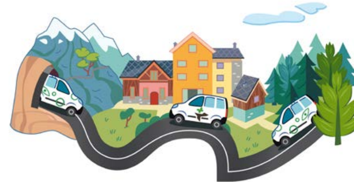
Progetti "Rê.V.E. - Grand Paradis" e "Cityporto Aosta - consegne in città"

Monitoraggio mobilità elettrica in Valle d'Aosta