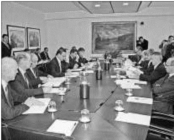
Aosta, il tavolo di confronto con le commissioni Affari costituzionali