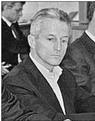
Il presidente della giunta Illy