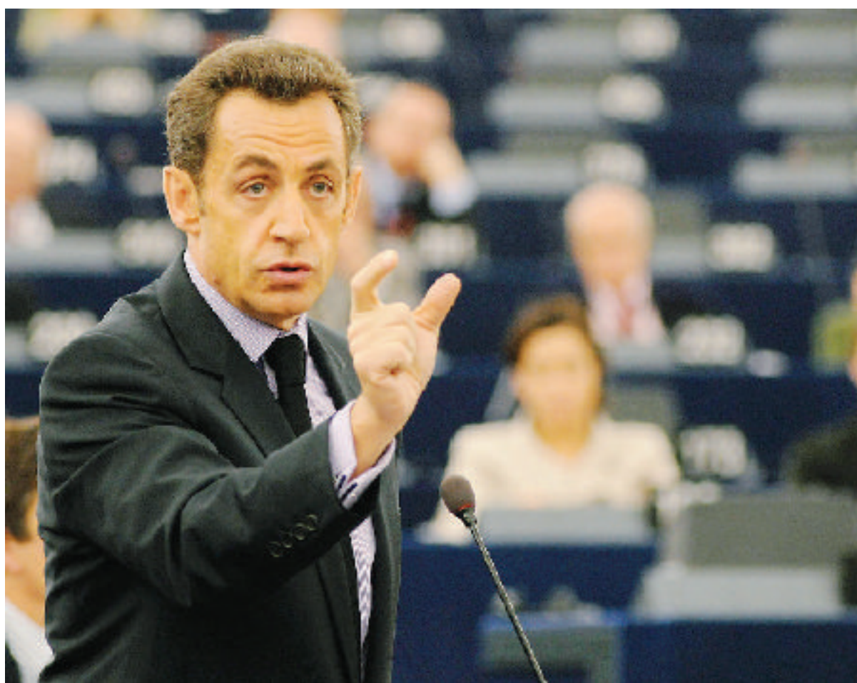
Il presidente francese Nicolas Sarkozy è anche presidente di turno dell'Unione Europea

Nicolas Sarkozy, che ama «molto» l'Italia e che spesso fa notare «di averlo dimostrato personalmente», gela l'offensiva di Silvio Berlusconi contro il pacchetto Clima/Energia. Posto che sarebbe «drammatico e irresponsabile abbandonare le misure per ridurre le emissioni», e ammesso che «bisognerà trovare delle linee di flessibilità nel rispetto degli obiettivi e del calendario», il presidente francese e guida di turno dell'Ue manda a dire a Roma che di decidere all'unanimità, come il premier ha annunciato la scorsa settimana dopo il vertice di Bruxelles, non se ne parla nemmeno. La strategia verde, ha precisato Sarkozy intervenendo al Parlamento europeo, sarà approvata a dicembre con la procedura di codecisione, vale a dire a maggioranza qualificata in Consi-