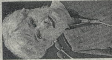
AL TIMONE Federica Guidi è ministro dello Sviluppo Economico

anni la spesa complessiva. A spingere lo sviluppo delle rinnovabili sono soprattutto le economie emergenti, la Cina su tutte, e gli Stati Uniti. I Paesi dove sono più ingenti gli investimenti in ricerca che stanno rendendo pale eoliche e pannelli fotovoltaici sempre più efficienti. Secondo una ricerca di CleanEdge, istituto americano specializzato nel mercato del "green tech", l'energia dal sole ha i margini di crescita maggiore, con il costo del fotovoltaico destinato a scendere costantemente con una media del 7% ogni anno.