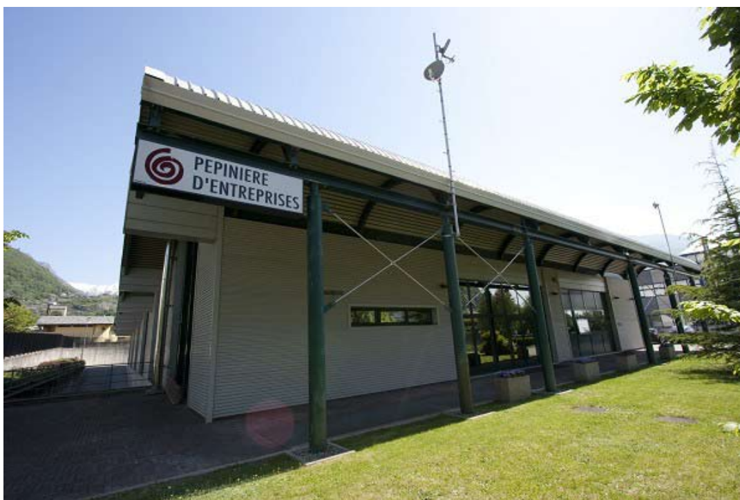
Pépinière di Pont-Saint-Martin

cento Centres Européens d'Entreprise et d'Innovation promossi dalla Commissione Europea, sorgono all'interno di innovativi complessi architettonici, situati nelle principali aree industriali della Valle d'Aosta: l'Espace Aosta e l'ex Illsa Viola di Pont Saint Martin.