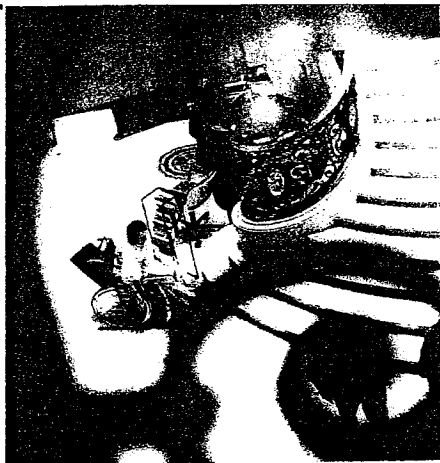
Un handicapé à la Sorbonne.