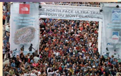
C'est sur l'Ultrasail Tour du Mont-Blanc, de renommée mondiale, que la charte environnementale a été expérimentée

Permettre aux «gens du pays» de rester sur leur territoire et réduire les impacts environnementaux et sociaux dans les zones à forte pression touristique sont les deux grandes priorités. Plusieurs pistes de travail sont identifiées: soutien aux activités économiques spécifiques à la montagne comme les produits du terroir, recours aux énergies renouvelables et mise en commun des bonnes pratiques environnementales, expérimentation de gestion de village intégrée et durable, formation des jeunes aux professions de la montagne, réduction des nuisances en favorisant les comportements responsables avec notamment la définition d'une charte environnementale et de ses contrats éthiques à destination des organisateurs de manifestations.