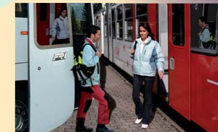
Le Mont Blanc Pass propose un voyage à la carte autour du Mont-Blanc par les transports publics

Un leitmotiv fort: faciliter les communications entre les vallées tout en diminuant les nuisances liées aux déplacements motorisés en renforçant très sensiblement l'attractivité des transports collectifs. L'objectif prioritaire est de pouvoir proposer en collaboration avec les sociétés de transport un accès illimité sur tout le réseau pendant plusieurs jours en lien avec la mobilité douce, action qui nécessite une coordination soutenue et la mise en place d'un système performant. Parallèlement, le recours aux énergies moins polluantes doit être favorisé.