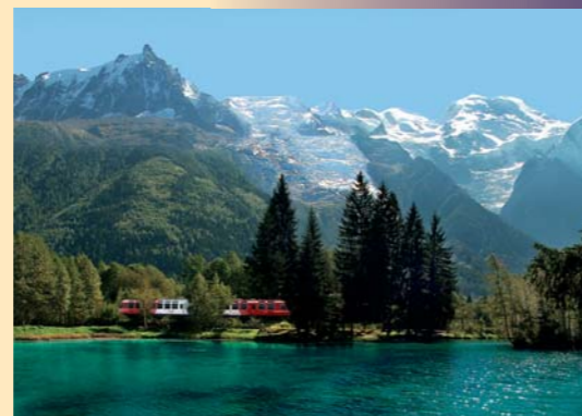
Schéma de Développement Durable

175, rue Paul Corbin Chedde - 74190 Passy - FRANCE Tél : +33 (0)4 50 93 66 73 Fax : +33 (0)4 50 78 25 79 e-mail : info@espace-mont-blanc.com