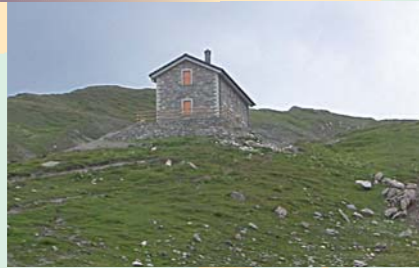
La caserne au Col de la Seigne entièrement rénovée en point d'accueil stratégique du Tour du Mont-Blanc

La randonnée, avec le Tour du Mont-Blanc comme élément fédérateur, doit être valorisée et diversifiée. La mise en réseau des manifestations culturelles et touristiques, l'information et la formation des acteurs locaux pour permettre une meilleure connaissance du territoire et de son patrimoine sont également au programme pour renforcer l'identité transfrontalière.