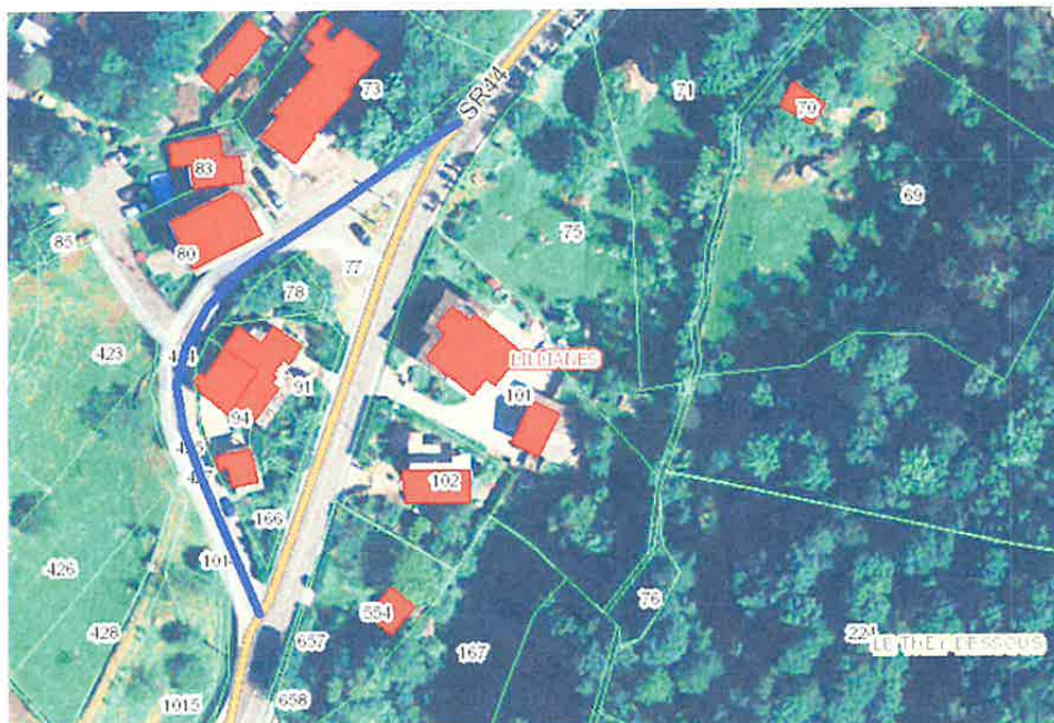
estratto da GeoNavigatore progetto SCT – Regione Autonoma Valle d'Aosta comune di Lillianes - dalla progressiva chilometrica 7+405 alla progressiva chilometrica 7+495